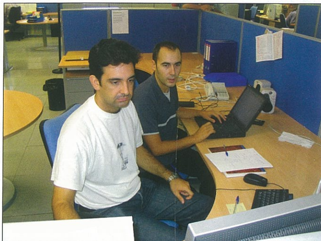
➤ Dos miembros del equipo de técnicos de Tartessos Technologies trabajando.

Considerando nuestra reciente creación, aún no hemos esta-