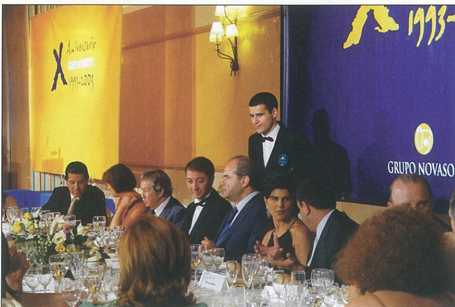
► Manuel Chaves preside la cena de gala del décimo aniversario de Novasoft.

compañía, a trabajar los procedimientos internos y a centrar su actividad en la producción", explicó Barrioueno, quien señaló que "ahora, en un momento crucial, nos toca poner todo el talento recopilado en valor para seguir creciendo".