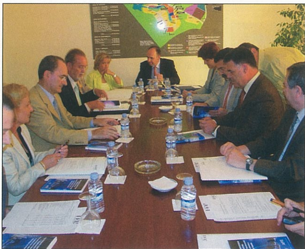
► Reunión del Consejo de Administración del PTA.

Tras la reunión del Consejo se presentaron además las parcelas adquiridas por el Grupo ACT Technology y Drake Europe para sus nuevas sedes, las obras en curso del Centro de Ciencia y Tecnología y otros edificios y una encuesta en la que empresas de Málaga, Madrid y Barcelona que habían visitado el PTA calificaban al mismo con una nota de 4,24 sobre una escala de uno a cinco.