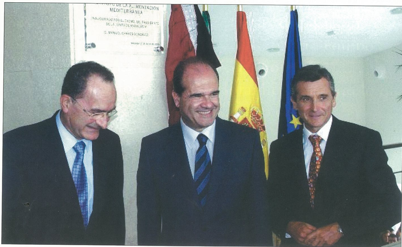
► El Alcalde de Málaga, Francisco de la Torre; el Presidente de la Junta de Andalucía, Manuel Chaves y el Consejero de Agricultura y Pesca, Paulino Plata.

El consejero destacó que el sector factura en Andalucía 11.000 millones de euros y produce 9.050, mientras que de cada cien euros exportados 46,6 provienen de pro-