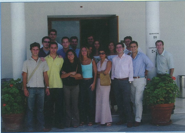
Alumnos del Programa de Creación de Empresas de Base Tecnológica que la Fundación de la Escuela de Organización Industrial (EOI) desarrolló durante el verano en el PTA.