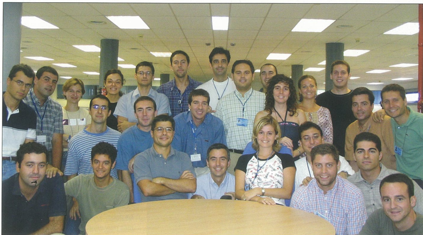
➤ Equipo de técnicos de Tartessos Technologies.

Tenemos trabajo en todas las áreas de actividad anteriormente descritas. Contamos con catorce ingenieros trabajando en proyectos diversos de consultoría en Finlandia y Estados Unidos y el resto de la plantilla en Málaga esta involucrada en proyectos de I+D.