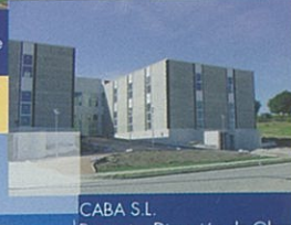
CABA S.L. Proyecto, Dirección de Obra y Cubierta Deck