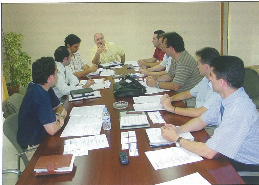
► Reunión de ETICOM en el PTA

Además de la Comisión de Innovación, ETICOM ha creado otras dedicadas a formación, relaciones institucionales y otros ámbitos de la actividad empresarial "porque nuestra capacidad de atender a todos estos procesos en nuestras reuniones gene-