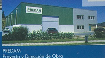
PREDAM Proyecto y Dirección de Obra