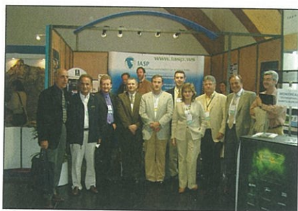
► Representantes de la Asociación de Parques Tecnológicos y Científicos de España (APTE) en la Conferencia de la IASP.

La conferencia se celebró en un momento en que, dentro de la construcción de la Sociedad de la Información "la promoción de la