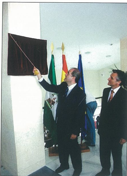
► El presidente de la Junta de Andalucía, Manuel Chaves, inaugura el Instituto.

La institución se dedicará, además de a la