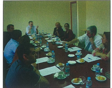
► Representantes de empresas durante la reunión.

Por su parte, Felipe Romera destacó que las empresas de servicios ofrecen oportu-